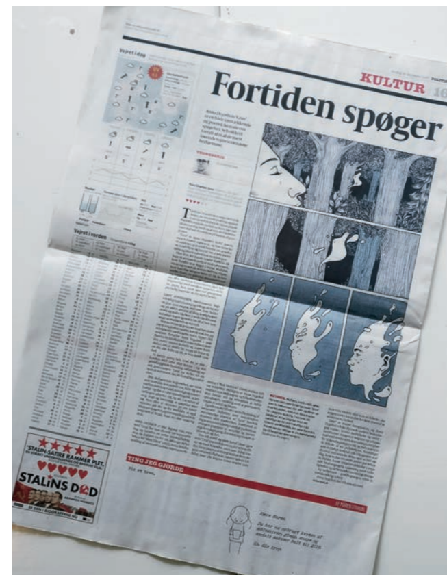
Anmeldelse i Politiken: http://politiken.dk/6268742