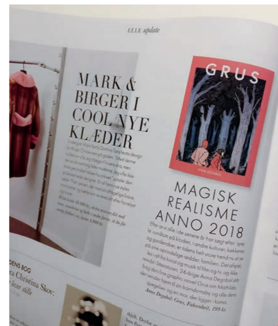
Elle News i Modemagasinet Elle