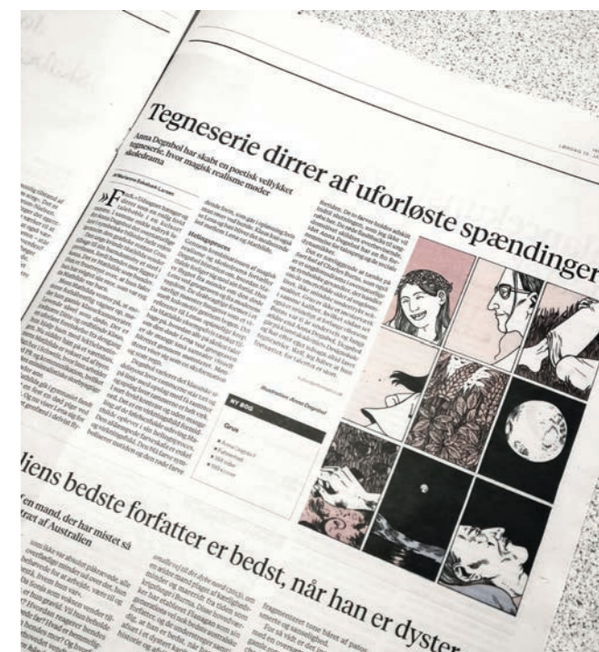
Anmeldelse i Information: https://www.information.dk/kultur/anmeldelse/2018/01/grafisk-roman-dirrer-uforloeste-spaendinger